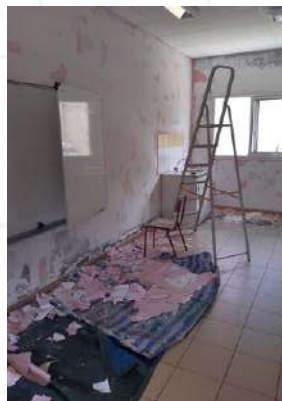
Photo 3 : À l'école primaire de Faja, 156 élèves ont fait leur rentrée.

Photo 2 : Les parents étaient présents et nombreux en ce jour de reprise.